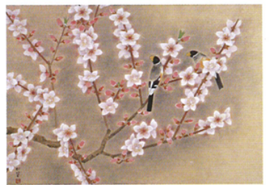
上村松篁 桃春 【公益財団法人佐藤国際文化育英財団・佐藤美術館蔵】 UEMURA Shokō Spring Peach blossom The Sato Museum of Art