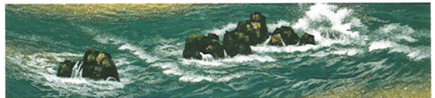
東山魁夷 満ち来る潮【山種美術館蔵】 HIGASHIYAMA Kaii Rising Tide Yamatane Museum of Art

本展では、東京美術学校の同期生である、東山魁夷と建築家吉村順三との交流から誕生した皇居新宮殿における建築と絵画を顧み、日本の伝統的に受け継がれる住空間と日本美という視点から二人の仕事を振り返ろうとするものです。皇居新宮殿の設計原図や写真資料と、壁画「朝明けの潮」に関連する本画及びスケッチや下図等を展示します。