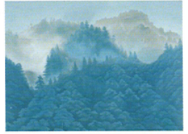
深山湧雲(リトグラフ) Clouds over Deep Mountains

魁夷は、代表的大作である唐招提寺障壁画において、日本の風土を象徴する風景として海と山を描き、鑑真和上に捧げました。海原から渚へと果てなく寄せる波、流れる雲の間に浮かび上がる不動の山々。島国日本の美しい風景を描いた作品を紹介します。