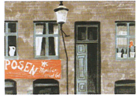
コペンハーゲン街角(リトグラフ) Street Corner in Copenhagen

1962(昭37)年、魁夷は北欧4カ国をめぐるスケッチ旅行に旅立ちました。雪と闇に閉ざされる北国の冬が終わり、春から夏にかけての白夜の季節。厳しくも清らかな自然と素朴な人々に出会い、初めて訪れる土地に心の故郷をみる魁夷の思い出の風景を辿ります。