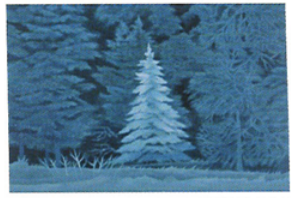
聖夜(リトグラフ) Holy Night

魁夷は極寒のドイツの森の中で、「樹々にとって、冬は終末ではなく、回生の春を待つ間の忍耐のひとつであること」を感じたといいます。四季を通じて自然の中に息づく生命に思いを寄せながら、魁夷が描く冬の風景を紹介します。