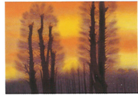
夕紅(リトグラフ) Evening Glow

風景を訪ね歩く魁夷が、取材地で見上げた空の趣は刻々と移り行き、時空の広がりを感じさせたことでしょう。「曙」「綿雲」「星の夜」など、旅の情趣を込めながら表情豊かに描かれた空を主役に、魁夷の心の風景を読み解きます。