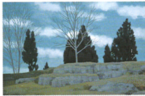
ウプサラ風景 Uppsala Landscape

魁夷の海外における重要な取材地である北欧スウェーデンの早春の情景「ウプサラ風景」や、蔵王にみる樹氷と夜空に瞬く星を幻想的に描いた最後の日展出品作「月光」など、当館が所蔵する本画作品と、滝を描いたスケッチを展示します。