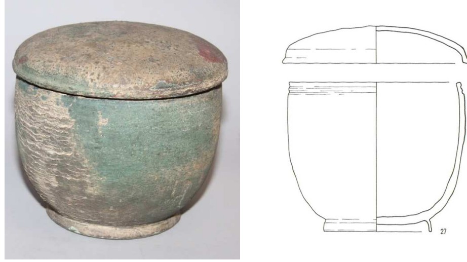
図3 猫坂古墓出土青銅製骨蔵器（東京国立博物館所蔵・秋特別展出品）