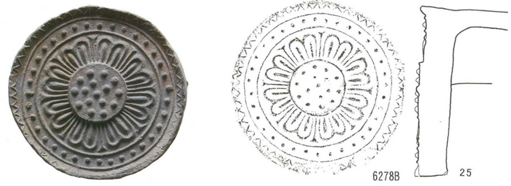
図2 宗吉窯跡出土軒丸瓦（左）と、藤原宮跡出土の同范瓦（右）