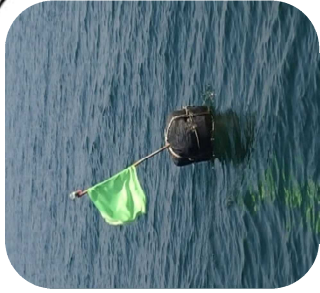
ブイが「たこつぼ縄」の目印です。

いつまでも楽しいイダコ釣りを続けていくためにも ルールとマナー を守って 安全 に釣りを楽しんでください。