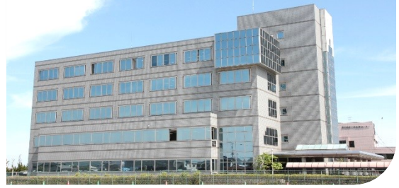
教育センター外観