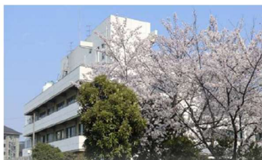
香川県立丸亀病院 Kagawa Prefectural Marugame Hospital