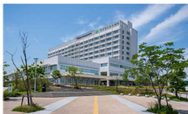
香川県立中央病院 Kagawa Prefectural Central Hospital