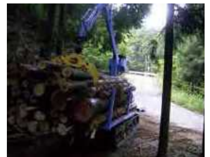
フォワードによる集材・搬出の様子

塩江琴南線は生活道として利用されているほか、災害時の代替路となるなど、周辺地域の暮らしを支えています。