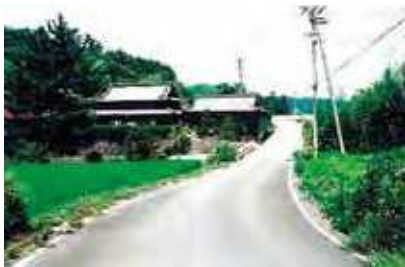
生活道として利用される五郷財田線

五郷財田線は集落間を結ぶ生活道としても利用されており、山村の活性化に役立っています。また、四国霊場札所がある雲辺寺山に続くロープウェイへの進入路として観光客やお遍路さんにも利用されています。