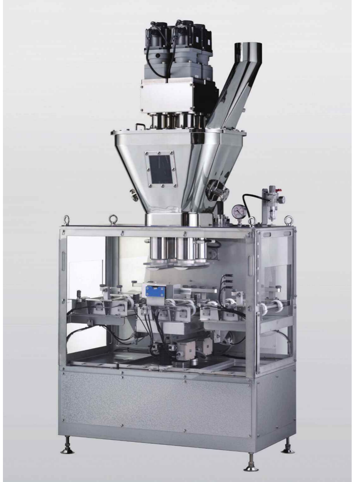
特許を取得した「4軸オーガー」