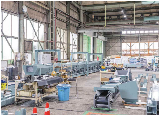
製造体制を強化し続け、創業の地で今も続くものづくり