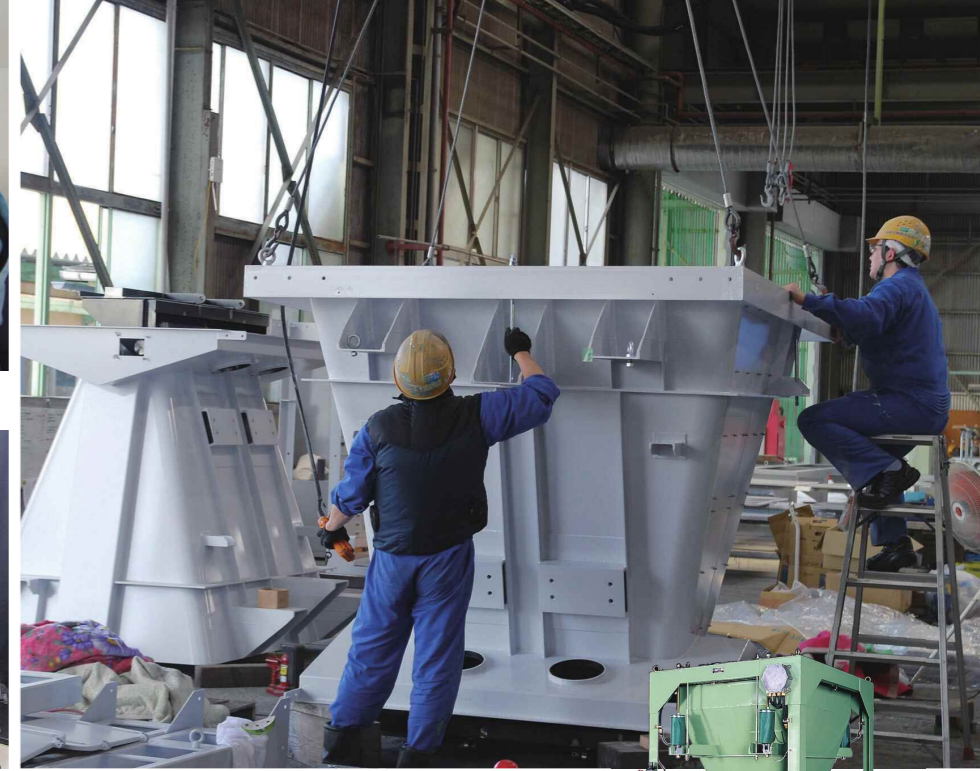
スケールは大きく、計量は精密に。右は粉・粒状のものをはかる「ホッパースケール」