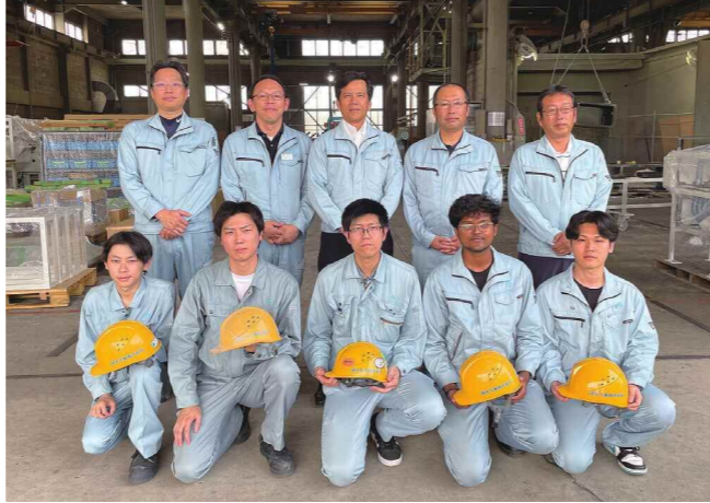
六車社長（後列中央）とものづくりの中核である技術本部メンバー