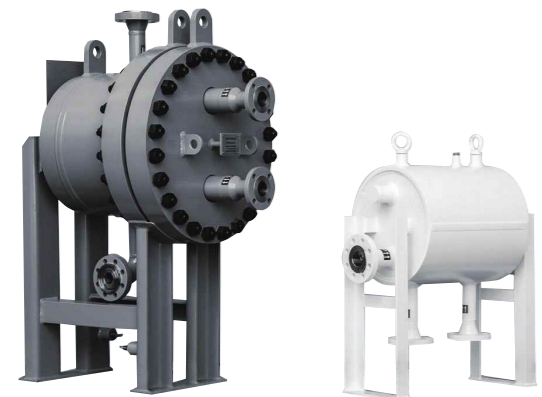
プレート&シェル熱交換器