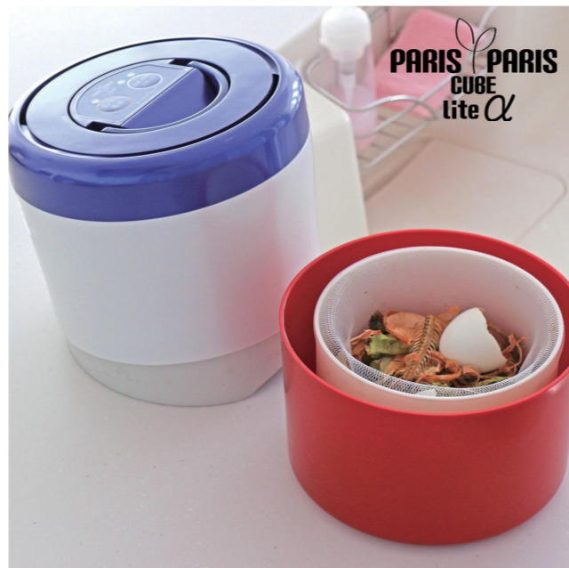
パリパリキューブライトアルファ