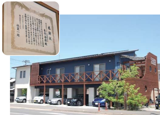
社員が自由に使えるレシピハウスなど、福利厚生にも力を入れており、社員から社長へ感謝状が贈られました

(公財) かがわ産業支援財団 ファンド事業推進課 ☎087-868-9903 高松市林町2217-15 香川産業頭脳化センタービル2階 http://www.kagawa-isf.jp/