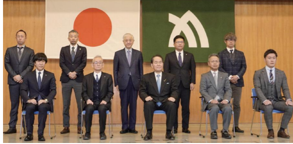
認定証交付式(2020年度)の写真

認定を受けた事業所は、県融資制度のBCP策定企業融資や損害保険の優遇措置が利用できます。その他にも、県内中小企業設備投資資金利子補給補助事業の補助上限額が200万円に引き上がるなどの特典もあります。