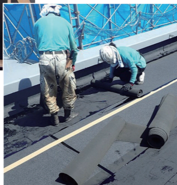
アスファルト防水材施工