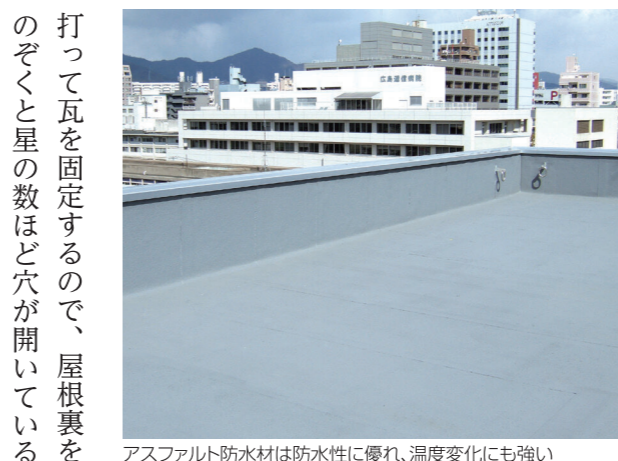
アスファルト防水材は防水性に優れ、温度変化にも強い