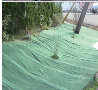
防草シート施工後