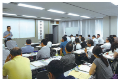
昨年度の「かがわ創業塾」

講師は、中小企業の経営相談に対応している経営・マーケティングなどの専門家の方々。創業に必要な知識やノウハウを、体系的・実践的に習得できる講義に加え、先輩創業者との交流や創業計画書の作成演習も行う充実したカリキュラムです。創業を目指す方の夢が形になるよう応援します。受講料は無料です。