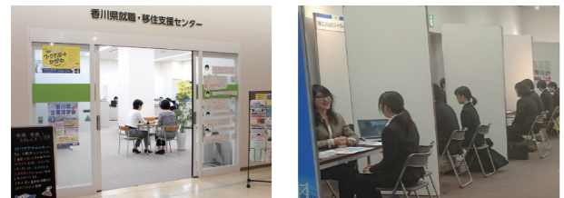
ワークサポートかがわ 昨年度の「お仕事ストリート」

(問い合わせ先)ワークサポートかがわ 高松市サポート2番1号 マリタイムプラザ高松2階 ☎087-802-4700 受付時間 8時30分~17時15分(年末年始を除く平日のみ)