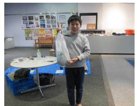
かがわの森アンテナショップ