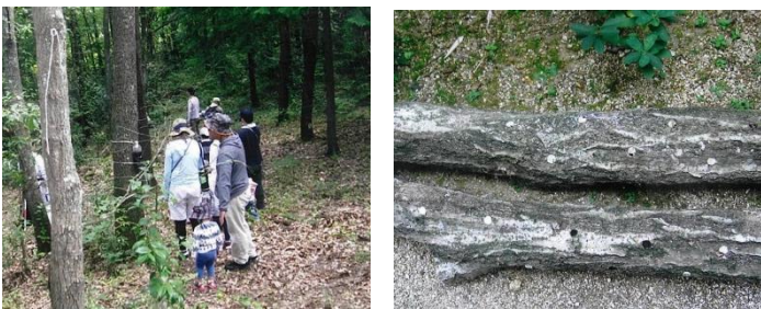
団体名：かがわあそびの学校 イベント名：森づくり指導スキルアップ講座

みどりの学校講座に参加すると、講座修了カードに みどりひろ丸シールが1枚もらえます。10枚シールを集め、みどり整備課へお送りいただくとDBポイント券がもらえます！（記念品は現時点でのものですので、今後変更になる場合があります。ご了承ください。）みどりの学校の日程もこちらのページで確認できます。