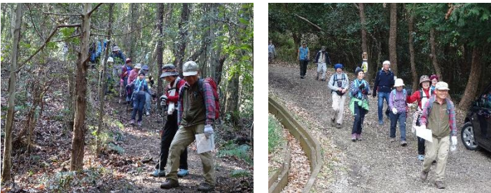
団体名：東讃里山ボランティアガイド イベント名：雲附山祭り