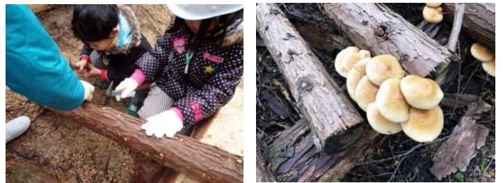
団体名：フォレストーズかがわ イベント名：ヒノキの間伐材でナメコをつくろう！