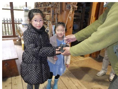
ドングリランドビジターセンター