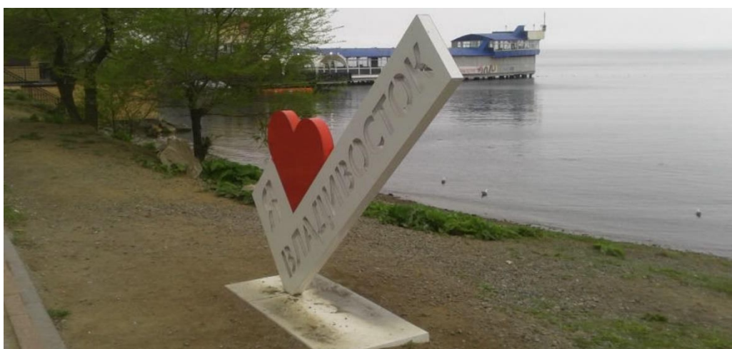
ウラジオストックへようこそ

初めて訪れたウラジオストックは寒くもなく暑くもなく、丁度良い気候。到着した空港からエクバトルホテルに移動する車中、壮大な自然と歴史的建築物や街並み等、感動的な瞬間を何度も味わいました。