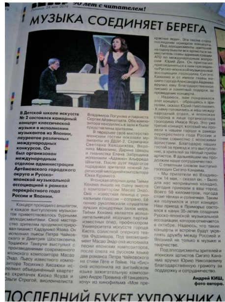
リサイタルの様子を伝える新聞記事