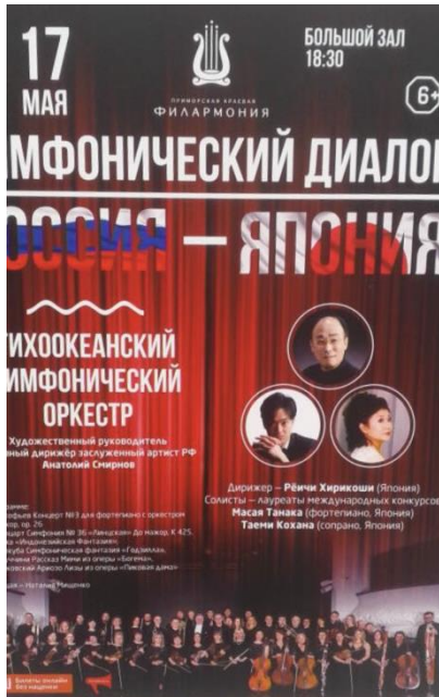
フィルハーモニーオーケストラ との共演コンサートポスター