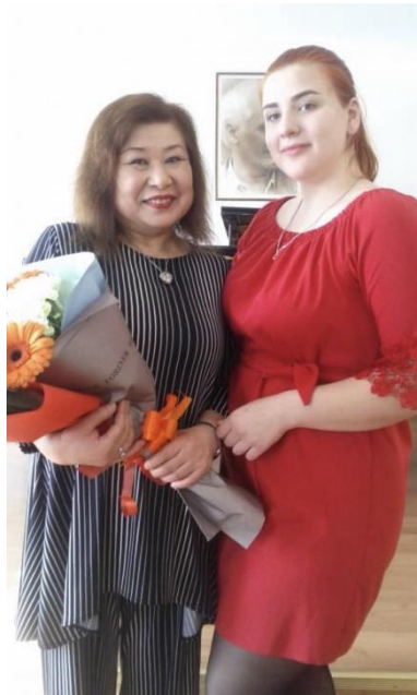
公開レッスンの学生と

翌日には極東連邦芸術 大学にて公開レッスンを 行いました。ロシアもまた 優秀な声楽家を沢山輩出 しており、舞台を夢見て声 楽を学ぶ学生は多いので す。