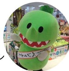
香川県産野菜イメージキャラクター ベジィさん