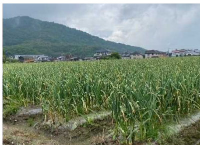
「にんにく」栽培ほ場