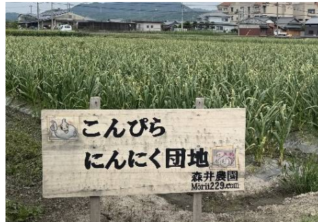
「にんにく」栽培ほ場