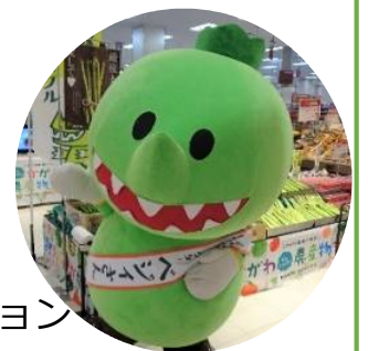
香川県産野菜イメージキャラクター ベジィさん