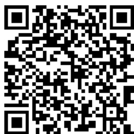
LINE みんなの使い方ガイド

※上記の方法で新たに友だちを追加したい場合やメッセージを受け取りたい場合は、再度設定を変更する必要があります。