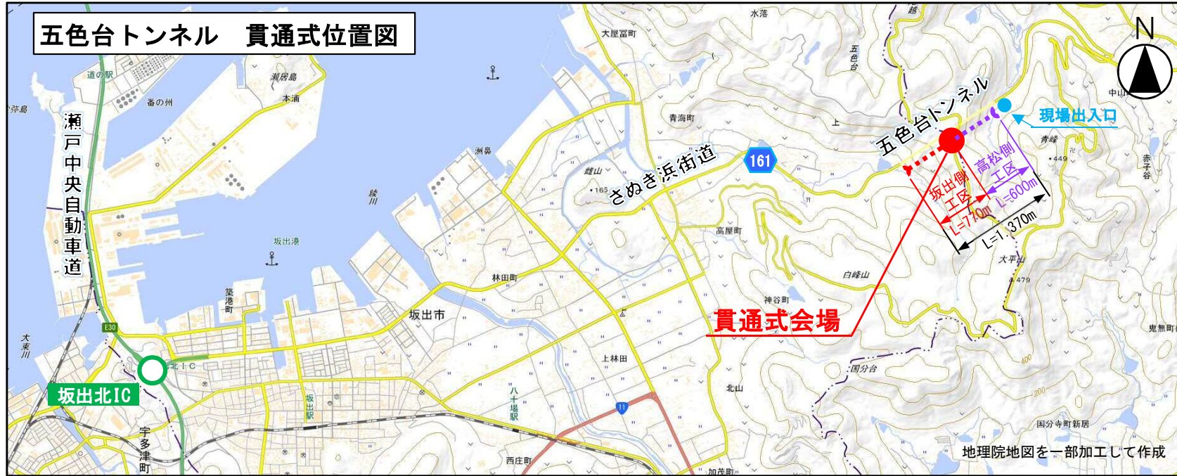
五色台トンネル 貫通式（高松側工区）案内図