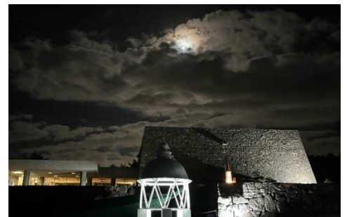
照明に浮かび上がる石積み(令和4年の様子)