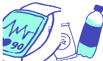
ウェアラブル端末、 応急セット