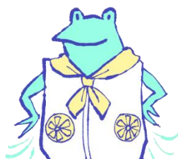
ファン付きウェア、 ネッククーラー