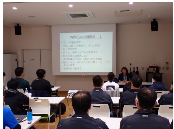
海洋ごみの問題点