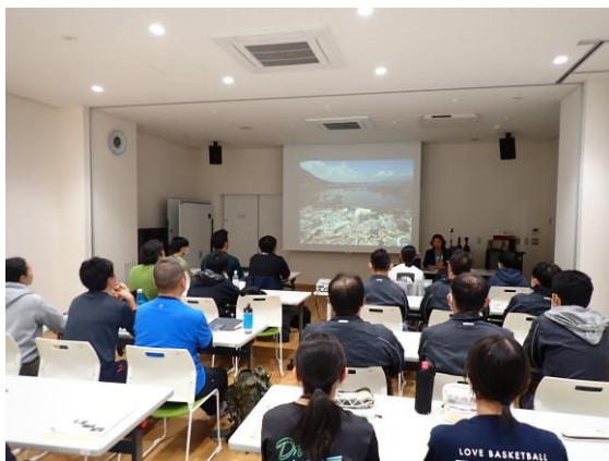
講座の様子、海ごみの現状

また、海岸に漂着しているごみの量を簡易に把握する方法の「水辺の散乱ゴミ指標評価手法」とごみの種類と個数を調べる「International Coastal Cleanup=ICC（国際海岸クリーンアップ）」の 2 種類の調査について、その目的と実施方法について説明がありました。