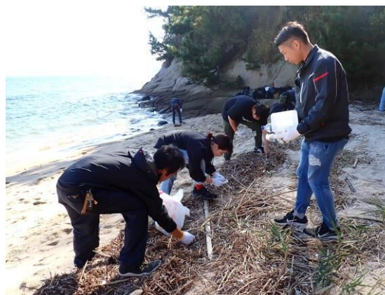
海ごみを回収する