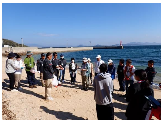
海岸で調査方法を説明

今回の受講生は、高校生や大学生、学校の先生など若く意欲的な参加が多くありました。今後、海ごみリーダーとしての活動や活躍が期待されます。