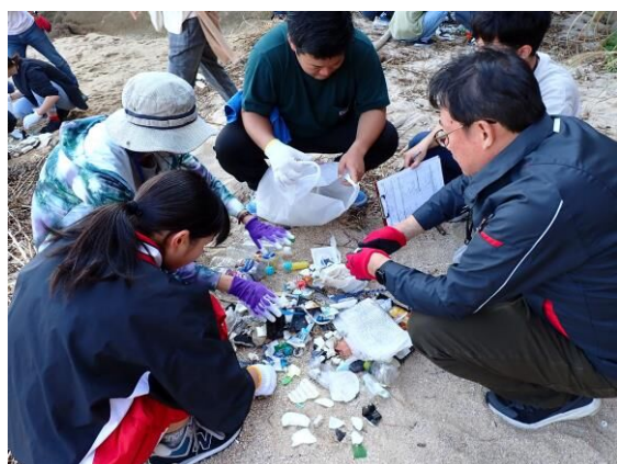
拾ったごみの種類を調べる