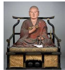
弘法大師坐像 (威徳院)