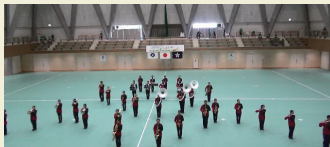
マーチングバンド・バトントワリング