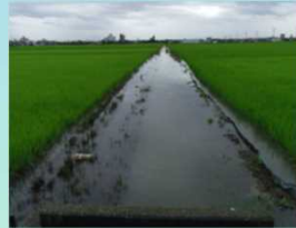
「田んぼダム」未実施