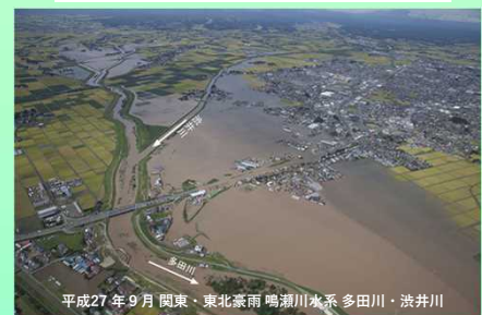
平成27年9月 関東・東北豪雨 鳴瀬川水系多田川・洗井川

https://www.mlit.go.jp/river/toukei_chousa/kasen/jiten/nihon_kawa/0205_naruse/0205_naruse_02.html