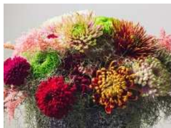
ディスバッドマム

9～10月は、県内各地で菊花展が開催され、丹精込めて育てられた鉢物のキクが一堂に集まる機会が多くなります。この機会に、ぜひ様々なキクの魅力を感じてみてください。