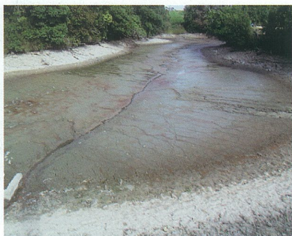
〈池干し中のため池〉