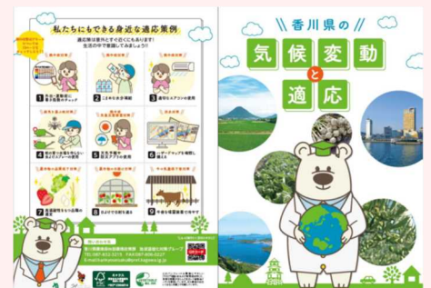
パンフレット「香川県の気候変動と適応」

県民の皆さまに、より気候変動を知っていただくため、香川県の気候変動影響などを紹介したパンフレットを作成しました。健康や県民生活など、各分野における現状や将来予測のほか、適応の方針についても掲載しています。