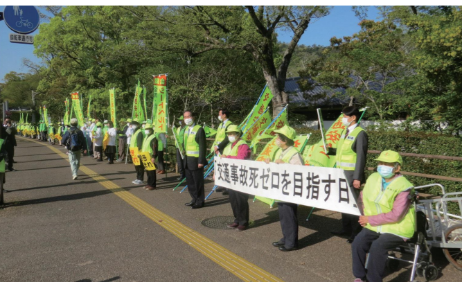
「交通安全死ゼロを目指す日」街頭キャンペーン

利用者を中心とした交通安全対策や飲酒運転など交通事故につながる危険・悪質な違反の取り締まりを強化するとともに、事故から身を守る行動の大切さを伝える広報啓発活動や交通安全教育を県民総ぐるみで展開します。社会の不安要因となっているストーカー、DV、児童虐待、特殊詐欺などの犯罪から子どもや女性、高齢者を守るため、関係機関・団体などと連携して迅速で的確に対処し、犯罪防止に向けた取り組みを強化します。