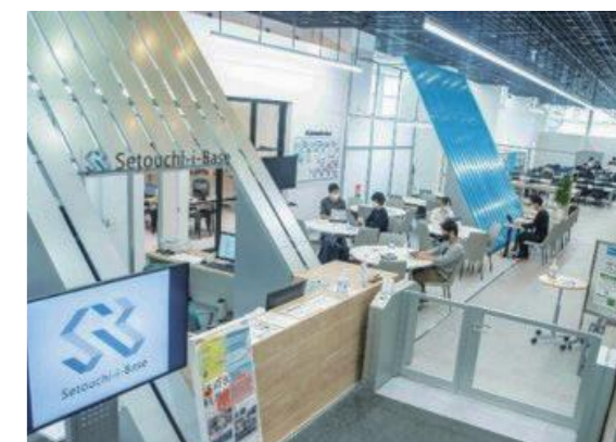
オープンイノベーション拠点「Setouchi-i-Base」

活や産業、行政のあらゆる分野でデジタル化が進んでいます。デジタル社会に向けた情報通信関連産業の育成や誘致を図るため、Setouchi-i-Baseを拠点に、地域や企業のデジタル化を支援、イノベーションを創出する人材を育成します。 デジタル社会の基盤となるマイナンバーカードの普及拡大に向けた周知活動を行うとともに、行政のデジタル化に向けて手続きのオンライン化を進めます。県内市町との電子申請・届出システムなどの共同利用を拡大し、行政サービスの向上につなげます。