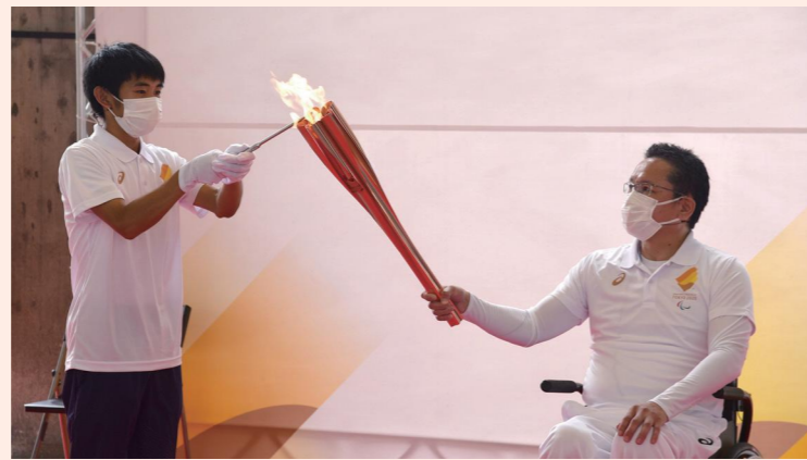
県庁東館ピロティで開催した「出立式」

東京2020パラリンピックの聖火は、2021年8月12日から各都道府県とパラリンピック発祥の地イギリスのストック・マンデビルで採火が行われ、48の火が東京で一つになりました。新型コロナウイルス感染症拡大の影響により、集火式と点火セレモニーは無観客で開催することとなり、県から代表者2人が参加しました。