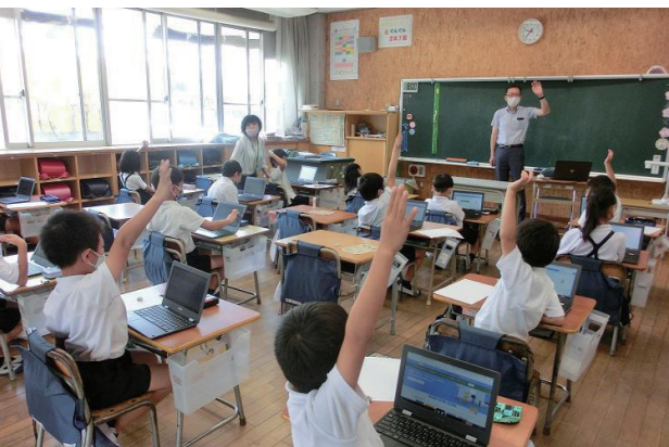
タブレットを活用した学びのスタイル

子どもの資質・能力を高める 子どもたちが未来を生きていくために、基礎的な知識や技能に加え、思考力、判断力、表現力などを育み、充実感や達成感を味わえる魅力的な授業を行います。「少人数学級」と小学校の「専科指導の拡充」を柱とする指導体制を構築するとともに、児童生徒の多様な実態に応じたきめ細かな指導を行い、子どもたちが安心して学べる学習環境をつくります。 グローバルな視点を育成するために、異なる価値観に接する