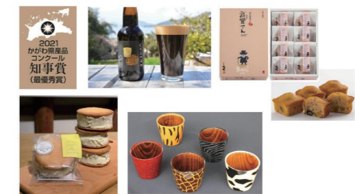
令和3年度かがわ県産品コンクール知事賞受賞産品

各部門1品ずつの4品、優秀賞も4品の合計8品を決定し、知事賞は私からお渡ししました。 これらの受賞商品は、県産品ポータルサイト「LOVEさぬきさん」でご紹介しているほか、県のアンテナショップ「かがわ物産館 栗林庵」や「香川・愛媛せとうち旬彩館」でのPRイベントで販売するなど、さまざまな方法で情報発信や販路開拓を支援してまいります。 新型コロナウイルス感染症の影響で、多くの県民の皆さまが、外出や外食を控えられていることと存じます。この機会に、あらためて県産品のおいしさ、品質の良さ、作り手の伝統を守りながら新しいものづくりに挑戦する情熱に触れていただければ幸いです。