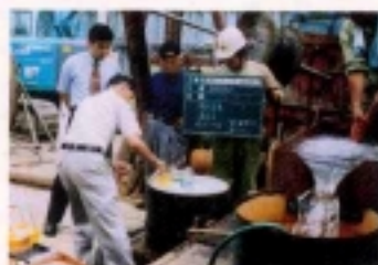
地下水の温泉分析

食品中の添加物や合成 抗菌剤、残留農薬など の調査や、温泉分析な どを行っています。 また、遺伝子組換え食 品の調査やシックハウ ズ症候群の原因といわ れる室内空気汚染の調 査にも取り組んでいま す。