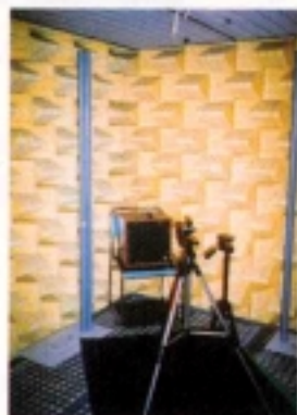
無音室での騒音解析