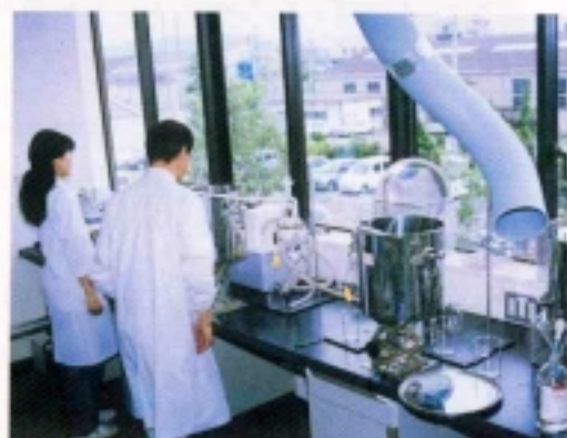
ダイオキシン類分析の前処理