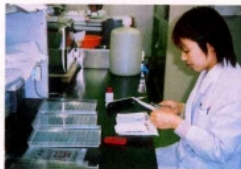
新生児代謝異常症等の検査