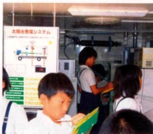
環境キャラバン車内での環境学習