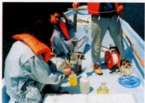
海域での水質測定

香川県衛生研究所と香川県環境保健センターと保健衛生に関する科学的、技術的足しました。