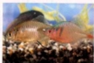
ニッポンバラタナゴ