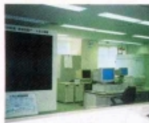
大気汚染常時監視・環境情報システムの中央監視室