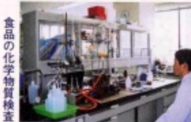
食品の化学物質検査