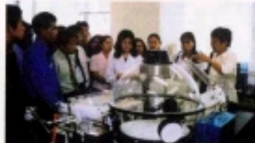
海外（ラオス国） からの見学研修

食中毒の原因となる細菌やウイルスについて調査を行っています。 水道水中のクリプトスポリジウムの検査を行っています。 呼吸器系ウイルス、腸管系ウイルス、エイズウイルスの検査や研究に取り組んでい ます。