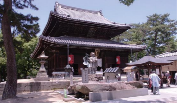
史跡四国遍路道 善通寺境内

保全していくか、今後世界文化遺産へ推薦するのはどのような資産がよいのか、などといったことが話し合われるとともに、今後、必要に応じて国内暫定一覧表の見直しも検討されるとのことです。