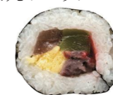
「さぬき恵方ロール」