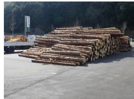
（原木ストックヤード）

森林環境譲与税を活用し、県産木材製品の安定供給体制を確立するため、県産認証木材を原木から加工した経費や、製材所における原木ストックヤード等の整備を支援しました。また、県産木材製品の性能を確認し客観的に評価するため、強度試験を実施するとともに、建築士や工務店等に住宅資材としての県産木材の良さをPRしました。 （主な実績：ストックヤードの設置、県産木材製品PR）