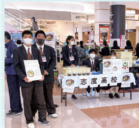
商業科産業教育フェア

すべての学科において、地元自治体や商工会、企業、大学等から講師を招き、最新の知識や技術、社会人として必要な心構えなどを学ぶ機会が数多くあります。また、地域の方たちの協力のもと、身の回りの課題について、学んだことを生かしてその解決方法を考える授業を行っています。