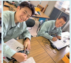
工業科実習風景(情報科学科)