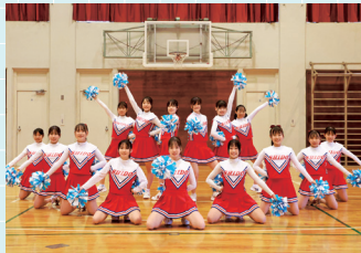
新体操・ダンス部パフォーマンス