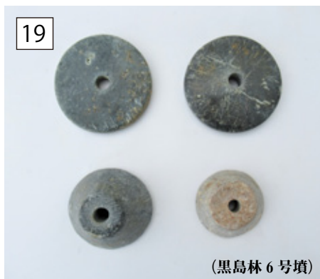
(黒島林 6 号墳)