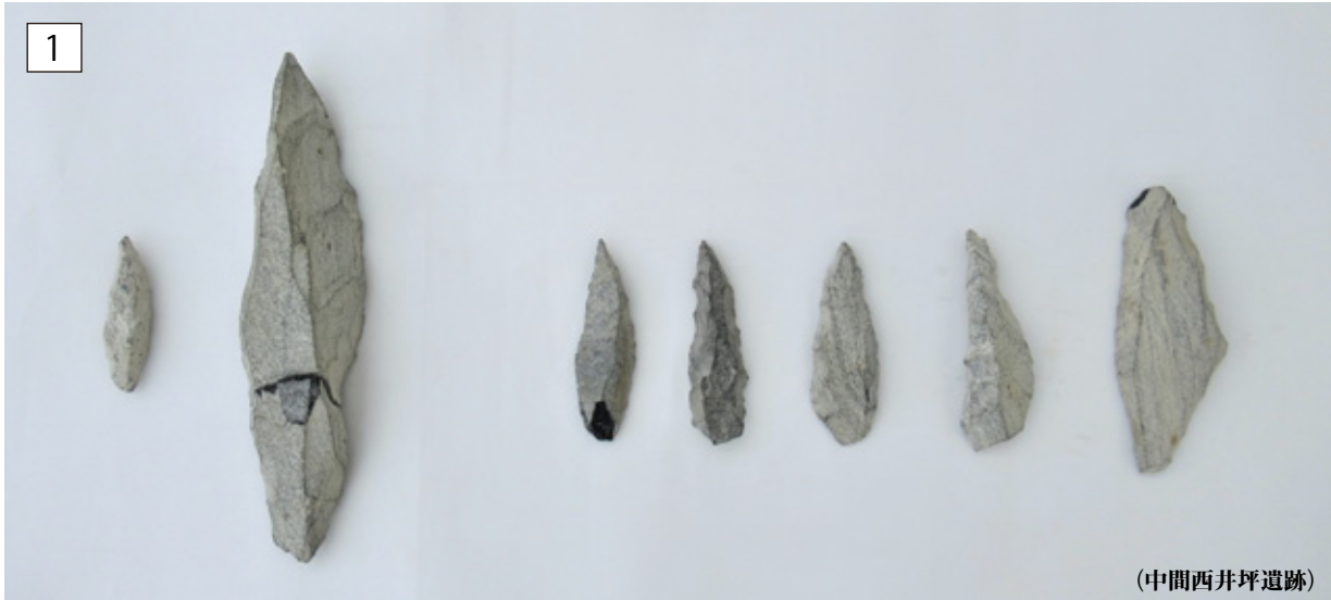
旧石器時代 ナイフ形石器 縦 3.8 ~ 11.7(cm) × 横 1.1 ~ 3.0(cm) × 厚 0.6 ~ 2.0(cm)