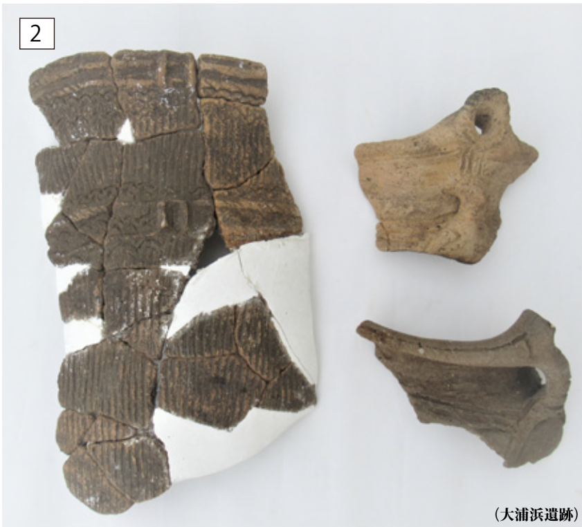
縄文時代 縄文土器 深鉢 縦 10.8 ~ 30.0 × 横 12.5 ~ 22.0