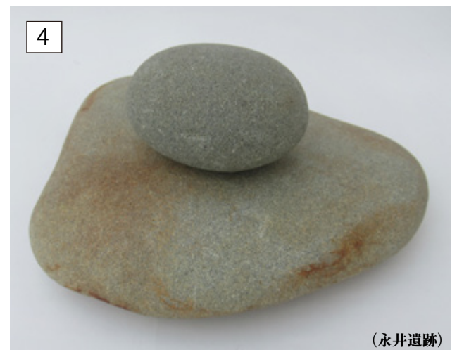
(上) 縄文時代 磨石 縦 7.2 × 横 6.0 × 厚 4.3