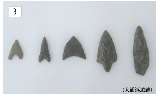
縄文時代 石鏃 縦 2.1 ~ 5.1 × 横 1.2 ~ 2.4 × 厚 0.2 ~ 0.6