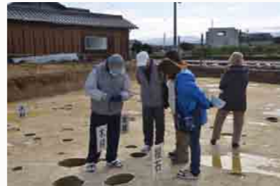
参加者も写真を撮るなど熱心に見学