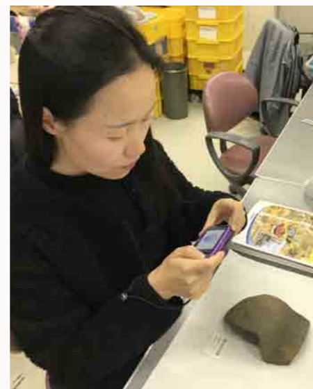
展示資料の写真撮影

毎日宝探しの気持ちで楽しくやりました。屋外では発掘現場で発掘体験をしました。鎌倉時代の土器の破片をたくさん掘り出しました。そして土器洗いと注記もしました。ものすごく貴重な経験になりました。現場の作業員のみんなはとても親切な方で、寒さや暑さを恐れずに丁寧に発掘作業をしていた姿にとっても感心しました。