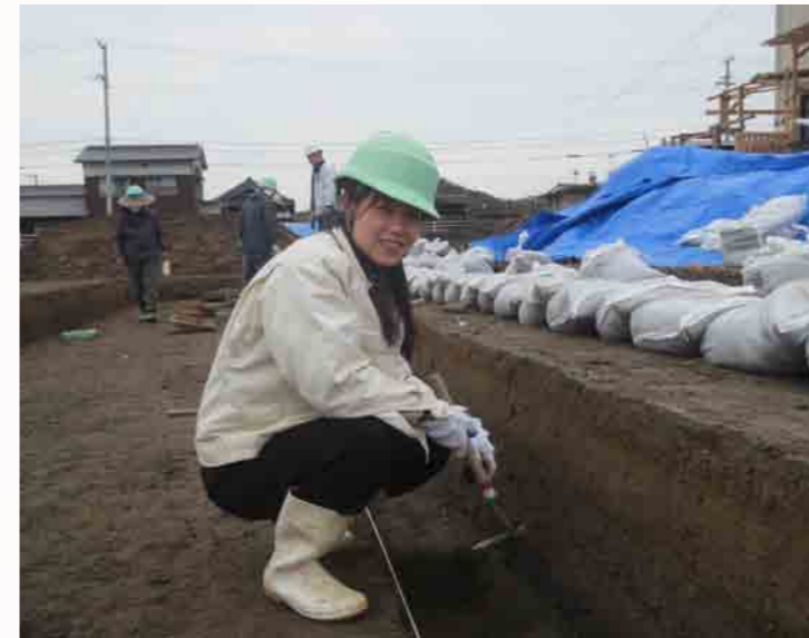
讃岐国府跡での発掘体験