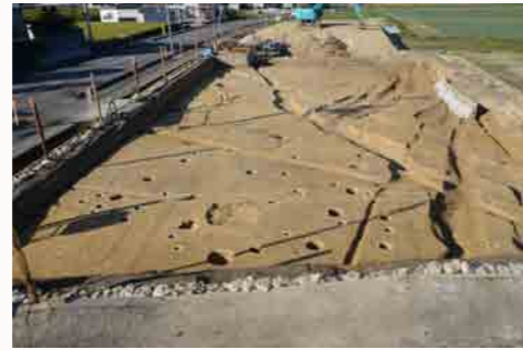
発掘調査で見つかった柱穴跡や溝跡

高松市香南町の池内古田遺跡では鎌倉・室町時代の溝跡や江戸時代の集落跡・溝跡と、当時の食器(皿、椀など)や調理具(鍋、すり鉢など)が出土しました。これらの溝跡は周辺の田畑を潤すために掘られたと考えられるため、集落と田畑が広がる現代のような風景が中世にまで遡る可能性があります。