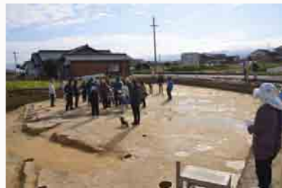
水たまりが残る調査区内での解説

また、1月25日(土)、発掘調査の成果をお披露目する現地説明会を行いました。地元の方を中心とした約40人の参加者に「どうしてここを発掘することになったのか?」「掘って何が分かったのか?」などについて紹介した後、連日の雨で大きな水たまりが残る調査区に入って、柱穴跡や溝跡について、また江戸時代から現代に至る土地利用の移り変わりなどについて紹介しました。参加者たちは調査員に質問したり、遺構や遺物などの写真を撮ったりして、この地のかつての姿に思いを馳せていたようです。