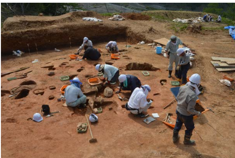
内山遺跡（宮城県女川町）調査風景