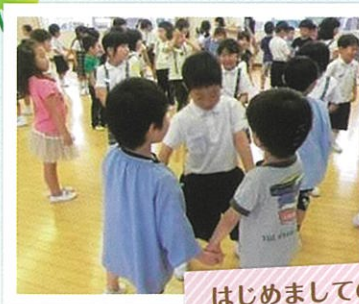
はじめましての会