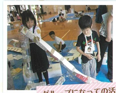
グループになったの活動