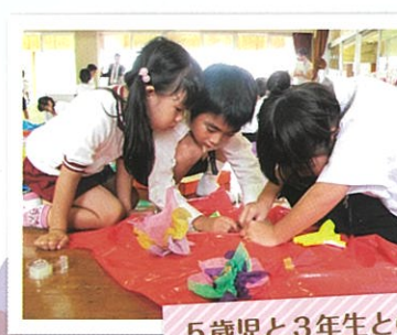
5歳児と3年生との交流