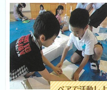
ペアで活動しよう