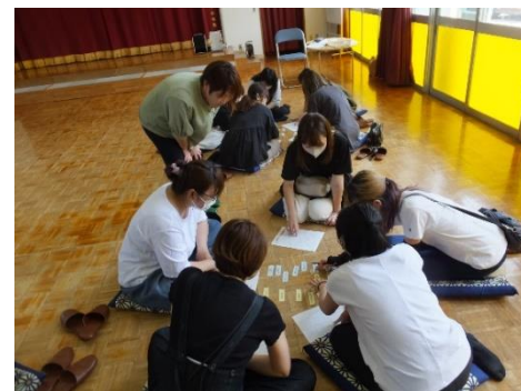
親同士の学びを取り入れたワークショップ