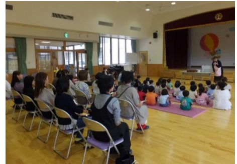
親子読み聞かせ教室

◆ゼロ予算事業◆（予算を伴わず、創意工夫により行政サービスの一層の向上を図る事業です。）