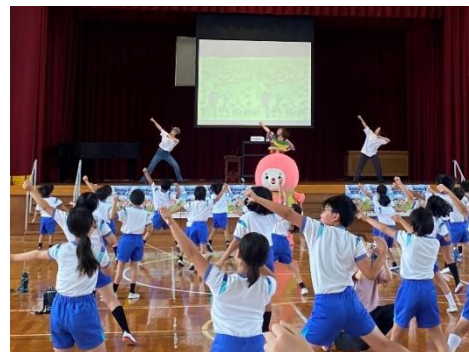
生活習慣スクールキャラバン

いじめ、不登校、発達障害、子育て、ネットトラブルなど、学校教育や家庭教育上の問題についての電話相談や臨床心理士等による面接相談等を実施します。