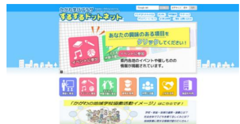
するするドットネット トップページ