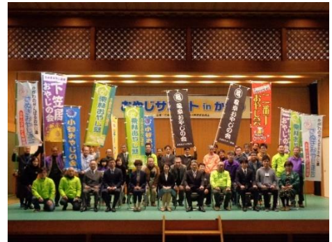
地域で子どもを育てるおやじの会