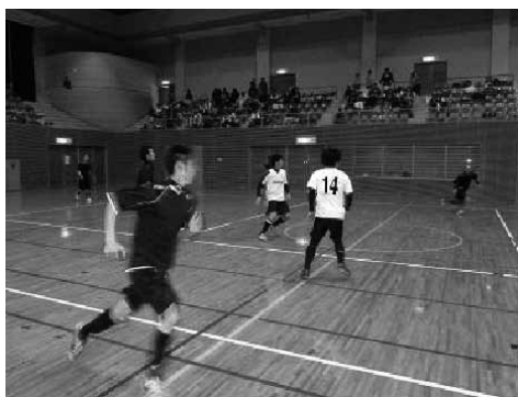
〔土庄町フットサル大会〕

連絡先 土庄町教育委員会生涯学習課 電話 0879-6217013 電話 0879-6210387