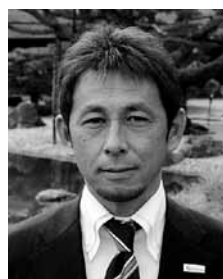
カマタマーレ 讃岐