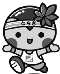
スポレク「エコとちぎ」2011 「とちまるくん」

県教育委員会事務局 保健体育課 生涯スポーツ担当まで TEL 087-832-3762 FAX 087-806-0235 かがわスポーツ情報ネット http://www.pref.kagawa.jp/sportsnet/