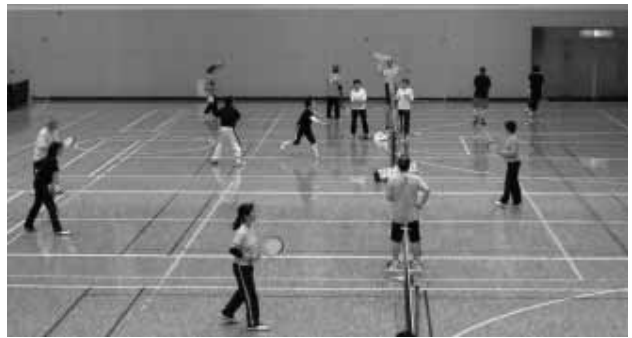
第3回香南ししまるスポーツクラブ杯全国シニア パドルテニス大会 [(4/30) 香川総合体育館]