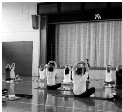
生涯スポーツ指導者養成講座はスポーツリーダー育成の場となっています。