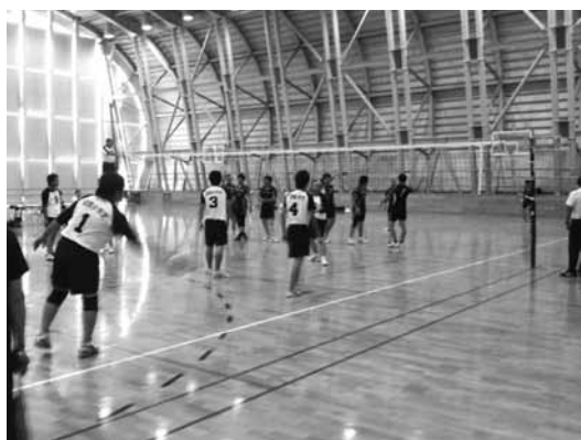
※写真は昨年の模様

※学生の参加条件など、競技種目によっては参加資格が一部異なります。詳細は、香川県青年大会基準要項によりご確認下さい。