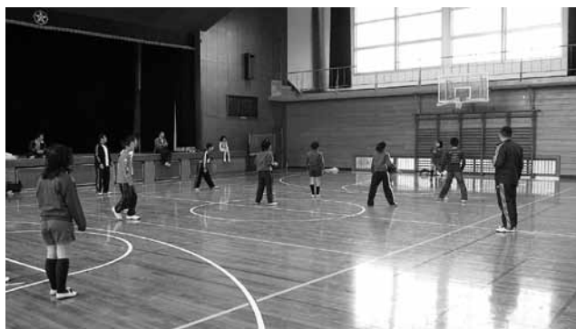
〔校区対抗ドッジボール大会〕

連絡先 琴平町教育委員会生涯教育課 電話 0877-7516716 電話 0877-7514120