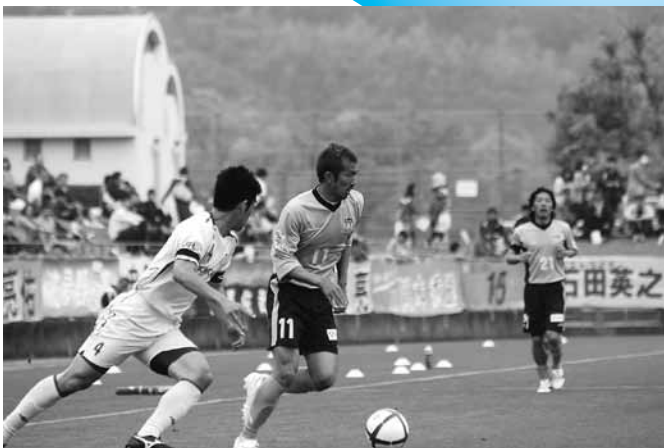
2011JFL ホーム開幕 [(5.3) 県営サッカー場] 〈カマタマーレ讃岐 VS 横河武蔵野FC〉