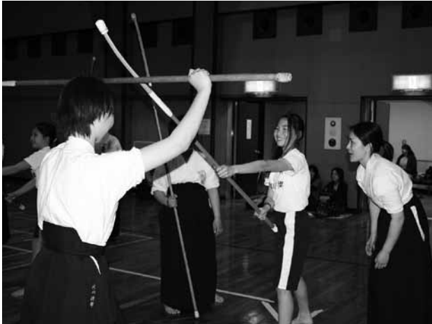
スーパー讃岐っ子育成事業 [(4/23) まんのう町農村環境改善センター]