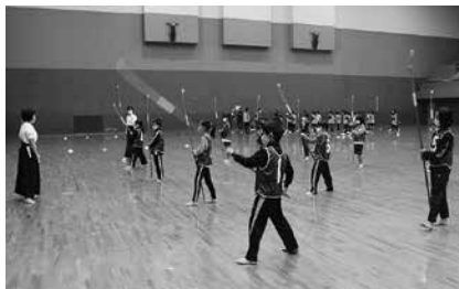
競技体験（なぎなた）