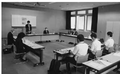
スーパー讃岐っ子選考委員会