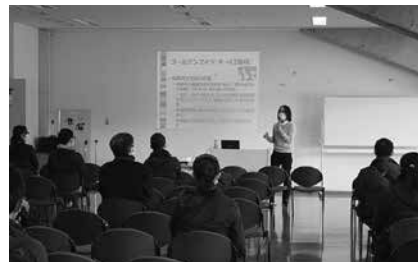
保護者プログラム