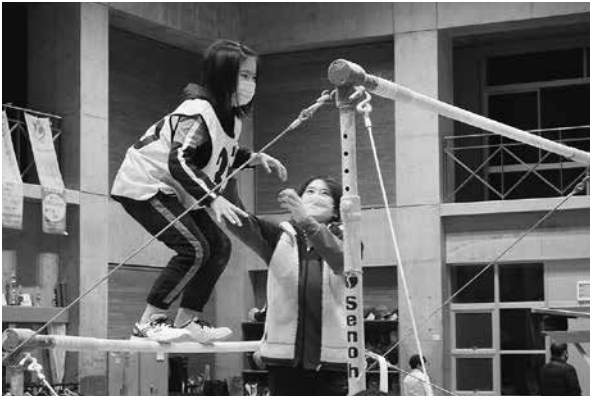
スーパー讃岐っ子育成プログラム (運動基礎プログラム) R3.12.4 (高松北高校)