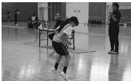
スーパー讃岐っ子第2次選考会

中学生になったスーパー讃岐っ子を対象としたプログラムも実施しており、スーパー讃岐っ子シニア生として活動しています。