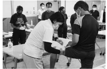
(昨年度の一コマ：テーピング法)

主 催 香川県教育委員会 受 講 料 無 料 申込・問合せ先 香川県教育委員会事務局保健体育課 スポーツグループ ☎087-832-3762 (直通)