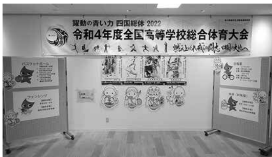
市民交流プラザ「IKODE 瓦町」の展示 4月28日(木)～5月5日(木)