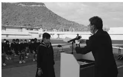
第12期・13期認定証交付式