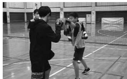
競技体験（ボクシング）