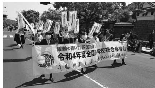
丸亀お城まつり「まんでガンガン大行進」 5月3日(火)