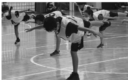
運動基礎プログラム