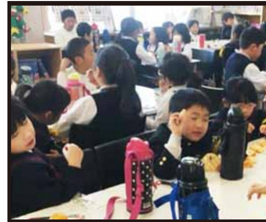
日常の食育活動として大切なおやつの時間