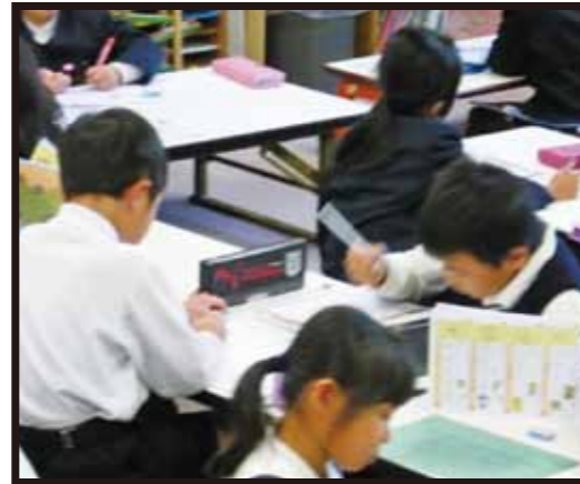
放課後の時間をのびのび過ごす子どもたち

放課後児童支援員とは都道府県知事が行う「放課後児童支援員研修」の修了資格を持つ人々のことです。