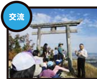
異年齢・異学年だけでなく異世代の地域の方との交流も貴重な体験です。