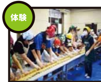
集団の中での様々な体験活動は子どもを大きく成長させます。

地域コーディネーターとは放課後子供教室などの地域学校協働活動を企画し、関係者との調整やボランティアの確保などを行う人々のことです。