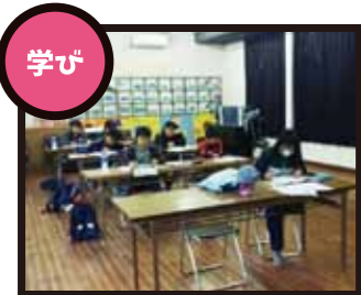
放課後等の子どもたちの安全・安心な学びの場を確保します。

希望する全ての児童を対象 放課後子供教室 地域コーディネーター、地域のボランティアにより児童たちの 学習・体験活動の場 を提供しています。