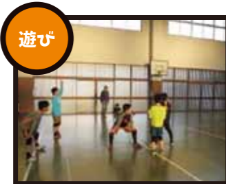
遊びの中で子どもは育つ!子ども同士の交流の中でコミュニケーション能力を伸ばします。