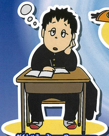
がくしゅう み つ 学習が身に付かない

いぞんしょう 依存症とは やらなければいけないことを放り出してでも、自分でコントロールできず、使用や行動をやめられない状態です。 ゲーム機やスマホ等の使い過ぎも依存症になる恐れがあります。