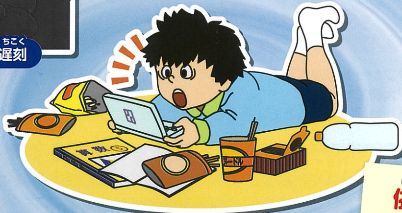
たいちよう わる 体調が悪くなる