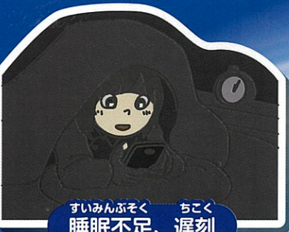
すいみんぶそく ちこく 睡眠不足、遅刻

ゲームやSNSの世界は、簡単に達成感を味わえるため、その利用がだんだんエスカレートしていきま つか す。使っていないとイライラしたり、不安 ふあん になったりすることもあります。また、体調が悪くな たいちよう わる ったり、寝不足 ねぶそく の原因にもなります。