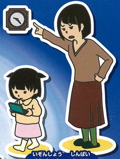
いぞんしょう しんばい 依存症の心配