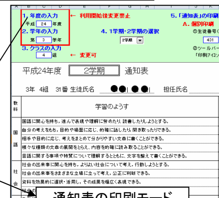
通知表の観点入力モード