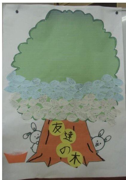
学びの足跡を教室に掲示

全学年で道徳授業を公開。(担当者は10月26日に参観) ■3年では「さか上がり」の教材で、「希望と勇気、努力と強い意志」を主題として、目標に向かって粘り強くやり抜く心を育てることを目標に授業が行われました。授業終末には家の人からの手紙が子どもたちに配られ、日頃のがんばりを認めてくれたり励ましてくれたりした言葉に、思わず涙ぐむ姿も見られました。目標に向かって、さらにがんばろうという気持ちが高まった様子でした。