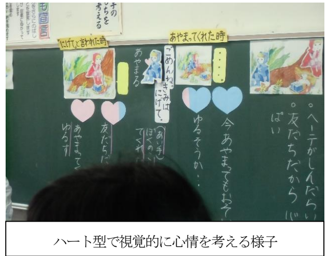
ハート型で視覚的に心情を考える様子

道徳授業を4回に分けて公開。■1年では「二わのことり」という教材で、「友情・信頼」を主題に授業が行われました。それぞれ別々の友達から誘いを受けるという場面は実際の生活でもあり得ることです。子どもたちは小鳥の役になりきって気持ちを表現しました。■2年では「ムモンとヘーテ」という教材で、「友情・信頼」を主題に授業が行われました。1年の思いやる「友情」に対して、2年は赦す「友情」に視点が当てられていました。■3年では「さか上がり」という教材で「勤勉・努力」を主題として、辛抱強く最後までやり抜くことの大切さを考えました。登場人物のがんばりを確認した上で、登場人物のがんばりに近づくために自分はどうかということを発表しました。■4年では「いっしょにやろう」という教材で「友情・信頼」を主題に授業が行われました。他を排除する弱い気持ちを乗り越えて、前向きな取組に変えていく話を読み、絆を強めていくために自分にできることを考えました。同じ「友情・信頼」が主題の学習でも、多面的・多角的な見方に発展していく指導の意図が感じられました。■5年では「やっぱりおかしいよ」という教材で「公正公平・正義」を主題に授業が行われました。グループで、3人の登場人物のうち、考えたい2人の人物の