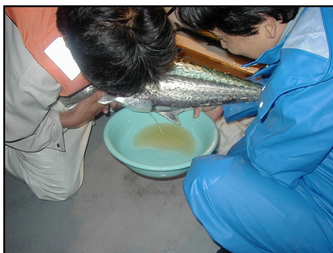
サワラ採卵人工授精