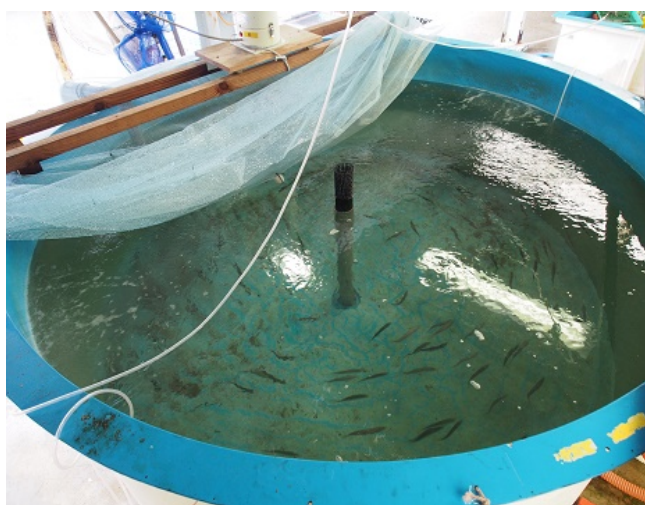
カタクチイワシの飼育試験