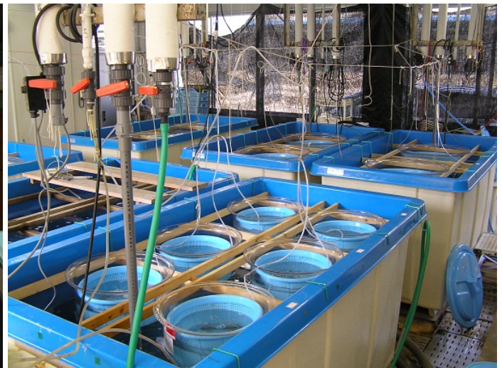
隔離実験室での病原体を使った感染実験風景

魚病が発生すると、魚の症状観察や臓器から病原体を分離し、病原体の特定や治療のための薬剤感受性をしらべ、対策指導を行います。