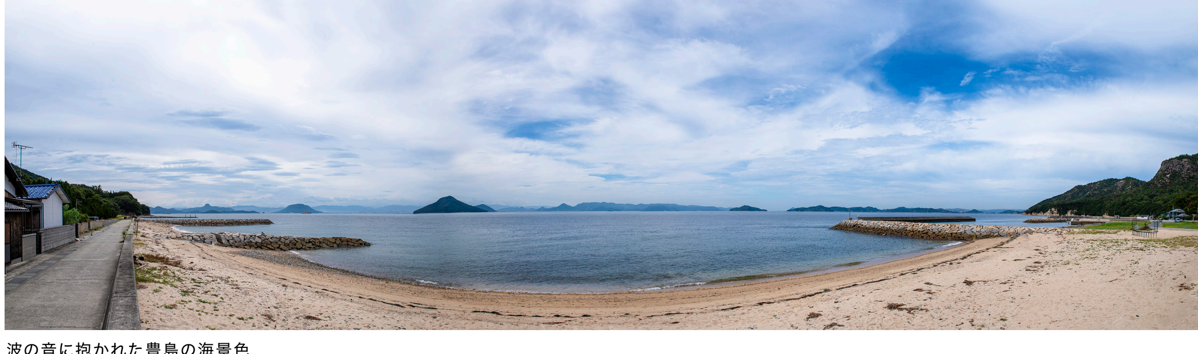
波の音に抱かれた豊島の海景色

宿の営業は、お客さまのご要望に合わせて応じていますが、家が海苔の養殖をしているので、11月~2月末の期間は休業させていただきます。だから冬季以外は、大歓迎です(笑)。季節や時間によって変化する海の表情と、潮騒だけしか聞こえないこの環境をご家族で味わっていただきたいなあと思っています。特に夕陽はとても綺麗ですから是非見ていただきたいですね。