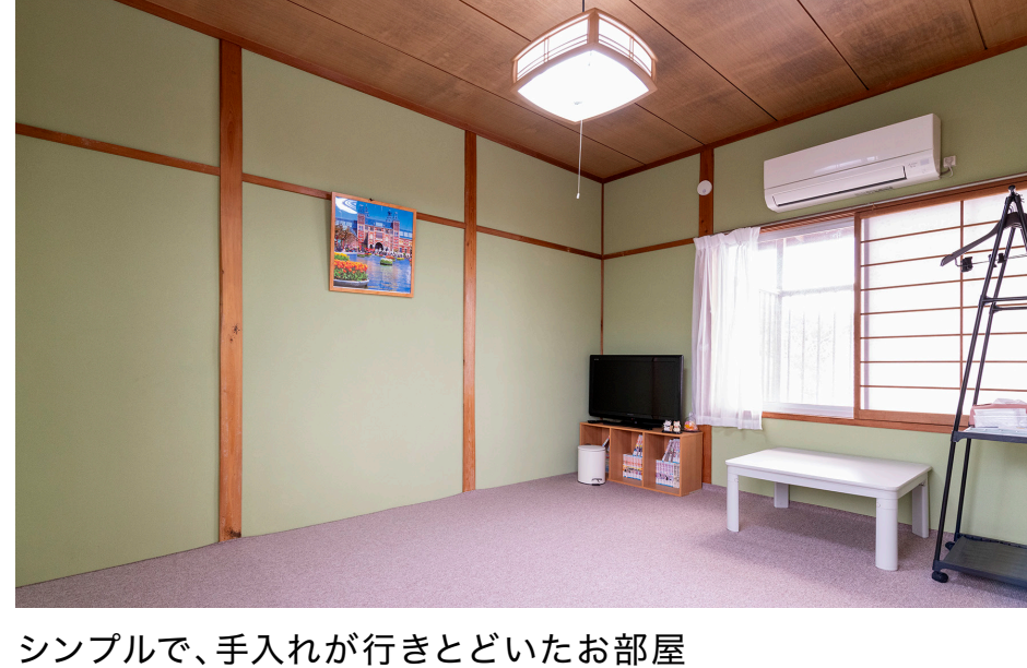
シンプルで、手入れが行きといたお部屋

民宿を始めるためには実家は傷みが激しかったので改修が必要でした。それと、Wi-Fi環境の整備やお客さまが使用する備品の用意など、とにかく色んなことに細々とお金が掛かりました。ですからベランダのペンキ塗りなど、自分が頑張ることができることは自分でして経費削減に努めました。