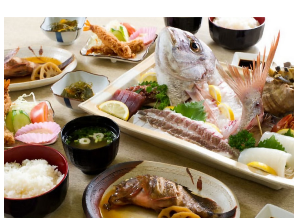
自慢の海鮮。鮮度・味・量ともに好評価

宿泊以外では『レンタルサイクル』『漁師体験』などをおこなっています。ただ漁師体験については、定期的なことや漁師さんの都合もありますので、ご希望の場合は予め電話で問い合わせさせていただきたいですね。