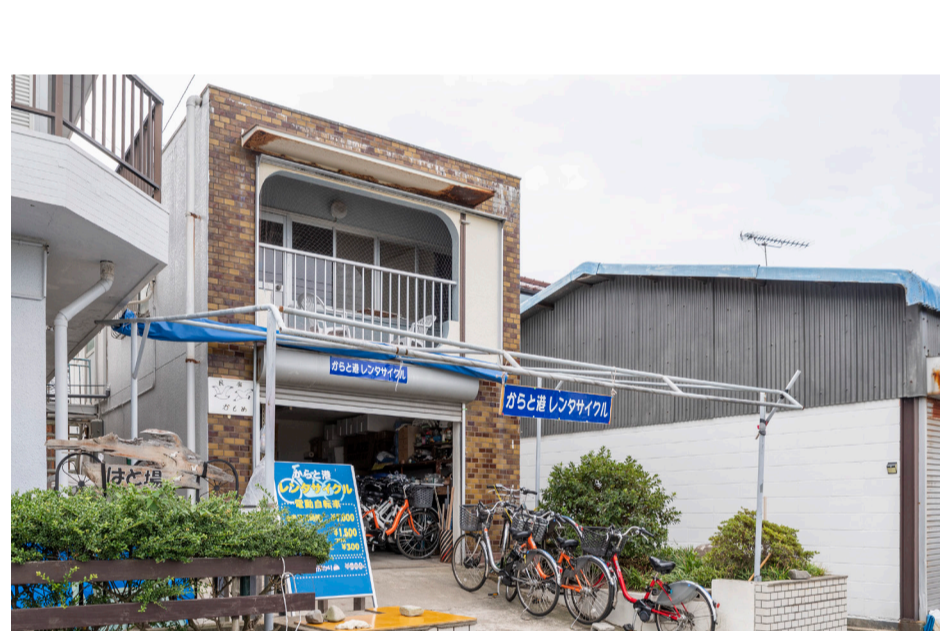
レンタル自転車も好評だそうです

元々客商売というか、人とのふれあいが好きだったので、民宿にお泊まり頂いた方との交流が続いていることが何より嬉しいですね。例えば、メールやお手紙を頂くことも多く、その言葉を読むと「おもてなしをして、本当に良かったな」と思いますし、何より人生の励みになりますよ。