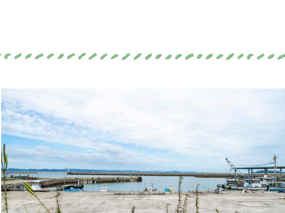
目の前には、のんびりした唐櫃港

ホテルなどと違い、親戚の家に来たような接客。これが「農林漁家民宿」の良い面じゃないかと思います。これはお客様だけでなく、経営する私たちにとっても大きな魅力だと思いますね。