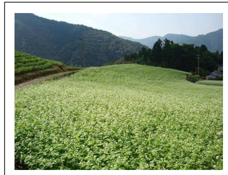
【ソバ畑：まんのう町琴南】

★あぐりんコメント：玉虫の乱舞を見ることが出来る場所が、いつまでも残るように私たち一人一人が努力することが大切ですね。伝統や文化と同じように、農山漁村の環境を守る人がいるからこそ、自然や景観も残すことが出来るといえます。まんのう町の琴南に、そんな自然が今も残っていることは素晴らしいです。