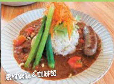
農村餐廳 & 咖啡館